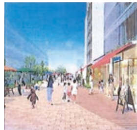
交流の小径イメージ