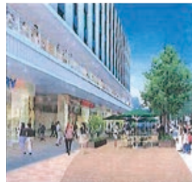
憩いの広場イメージ